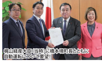
梶山経産大臣(当時)に橋本境町長とともに自動運転について要望!