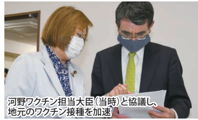
河野ワクチン担当大臣(当時)と協議し、地元のワクチン接種を加速