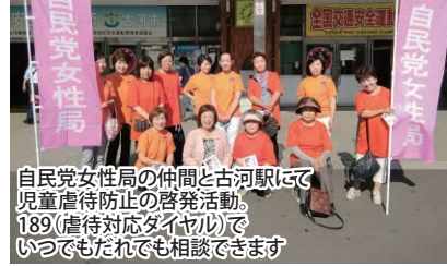
自民党女性局の仲間と古河駅にて児童虐待防止の啓発活動。189(虐待対応ダイヤリ)でいつでもだれでも相談できます