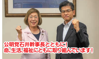
公明党石井幹事長とともに! 命、生活、福祉にも取り組んでいます!