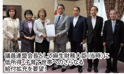
議員連盟会長として麻生財務大臣(当時)に低所得・子育て世帯へのさらなる給付拡充を要望!