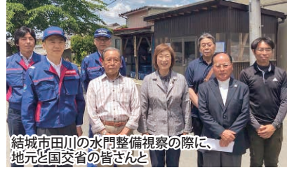
結城市田川の水門整備視察の際に、地元と国交省の皆さんと